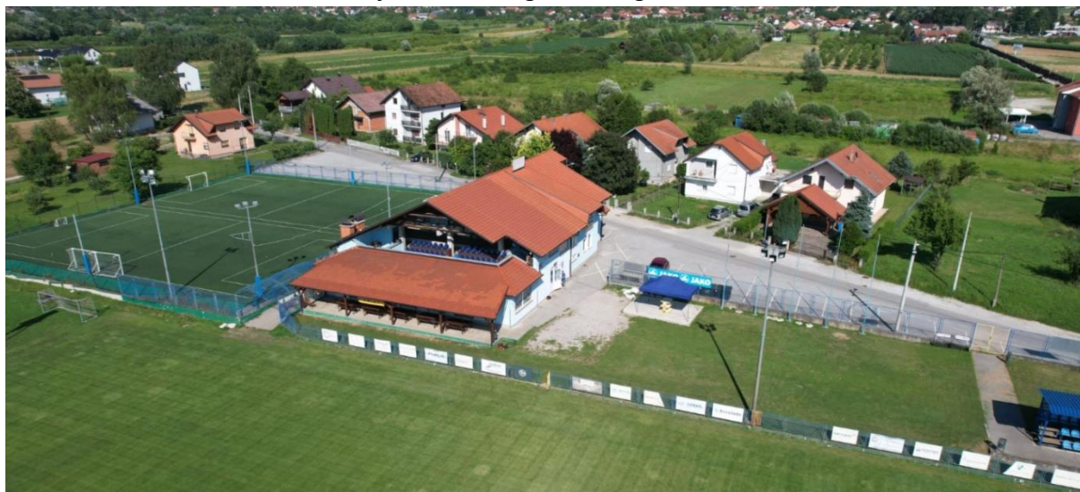
Slika 1. Donja Bistra – nogometno igralište SRC Bistra

nogometnim stadionima i igralištima Općina Bistra imala je rashode za održavanje nogometnih igrališta u svom vlasništvu odnosno režijske troškove sportskih objekata.